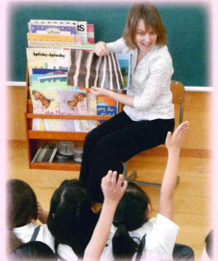
1年生 ナショナル ジオグラフィック リーダーズの読み聞かせ