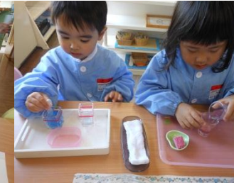
スポイト写し&水写し