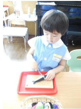
マジックテープ切り