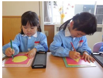
メタルインセツツ