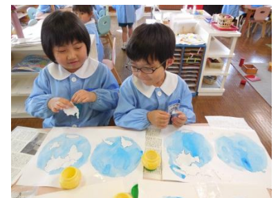
白と青の世界地図