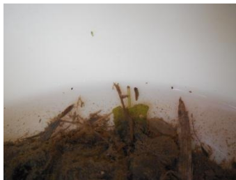
オタマジャクシの観察