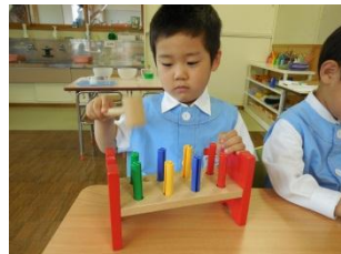
かなづちとんとん