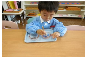
ピンセットうつし