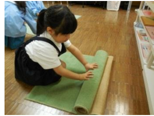
ジュータンの巻き伸ばし