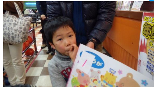
子どもの部・優勝おめでとうございます。