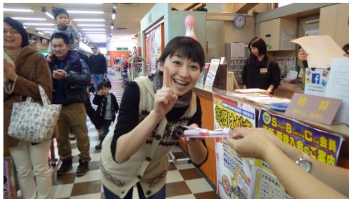
大人の部・優勝おめでとうございます。