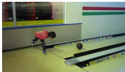
おっ! さまになってる!