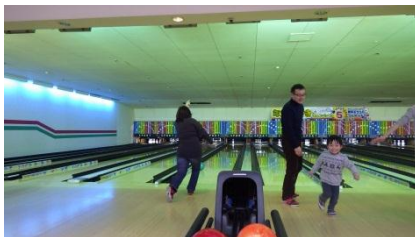
やった! いっぱいたおれたあー! 兄弟力を合わせて!