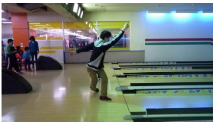
すばらしいフォーム