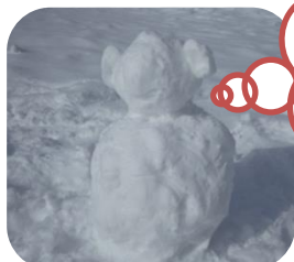
園長先生がつくってくれたよ！！