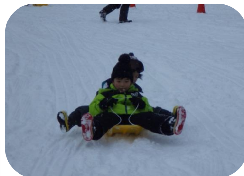
先生たちとも滑ったよ！ でも、たまに勢いよく転ぶことも！！