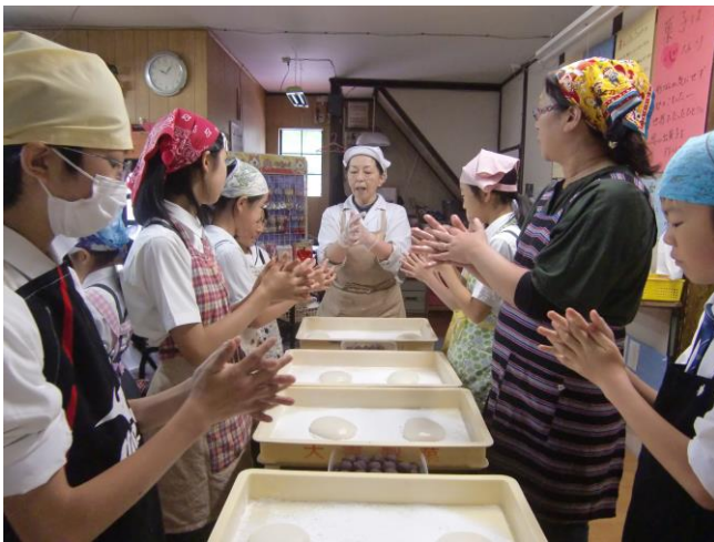
大福グループは、まず手に油をよーくつけます。