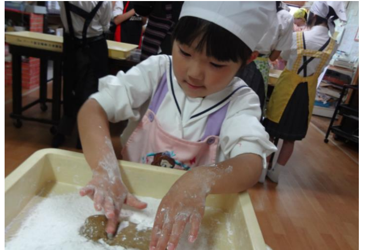
おまんじゅうグループは、手に粉をつけて、生地を9つに分けます。