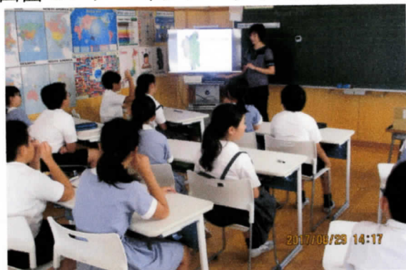
6年生の英語室での授業風景

子どもたちの学習環境整備としてこの夏休み中に英語室の机と椅子をスタイリッシュな物にリニューアルしました。白を基調としてワンポイントカラーのおしゃれなデザインです。大画面モニターやタブレット端末等を活用し、結果を出せる英語力向上にさらに努めます。