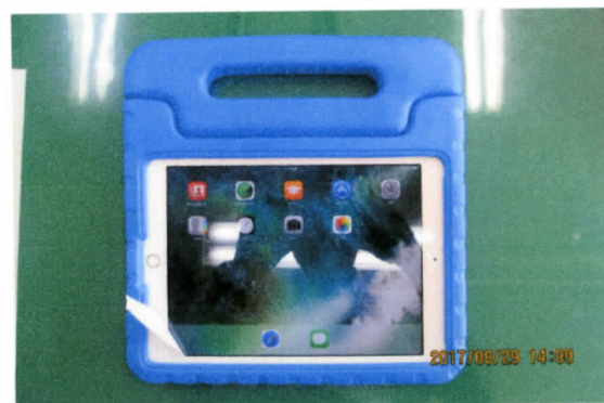
低学年児童も使いやすいタブレット

子どもたちにとって深く、楽しく、効率的な学びが得られるようICT機器を導入しました。各教室に電子黒板機能付き超短投射プロジェクターを設置し、タブレット40台も活用できる環境になりました。デジタル教科書等を活用し、教師の「教え方」と子どもたちの「学び方」の幅を広げ、子どもたちの未来を見すえたデジタル教育機器活用教育に取り組みます。まずはICTの日常化をめざし、職員研修を強化していきます。